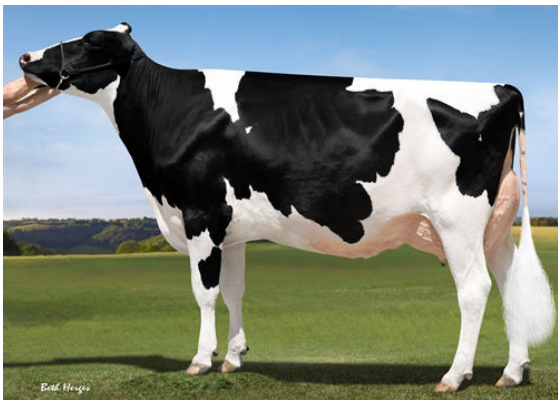
OUR-FAVORITE UNLIMITED THIRD DAM